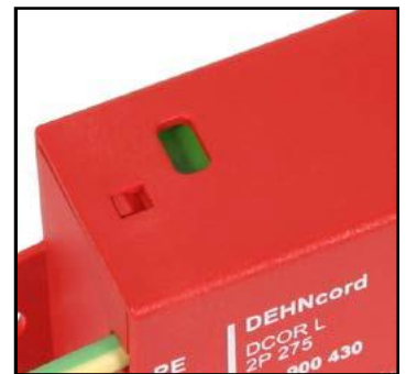
Los descargadores mostrados en las imágenes son: DCOR L 1P 275 ref.: 900431 y DCOR L 2P 275 ref.: 900430