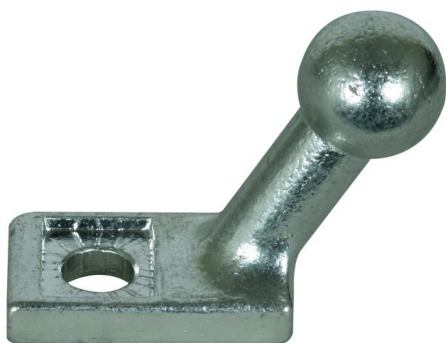
Fotografía no vinculante