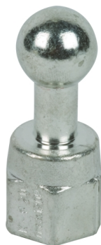
Fotografía no vinculante