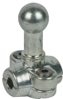
Fotografía no vinculante