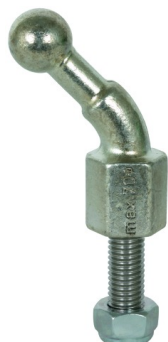
Fotografía no vinculante