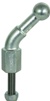
Fotografía no vinculante