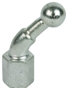
Fotografía no vinculante