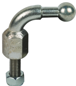
Fotografía no vinculante