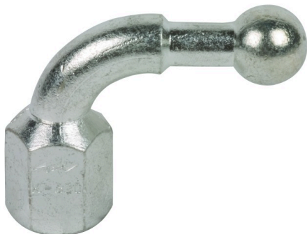
Fotografía no vinculante